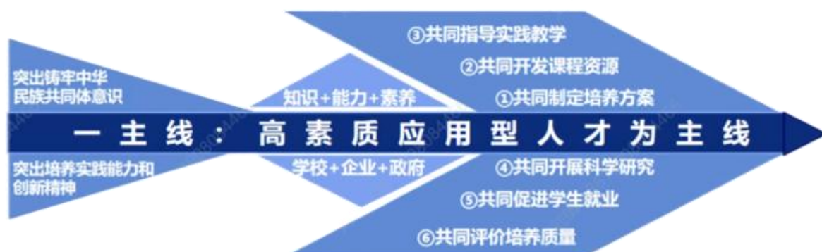
图 1. “12336” 人才培养特色